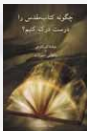
چگونه کتاب مقدس را درست درک کنیم؟ B5

مطالعه کتاب مقدس به مدت یک سال از طریق یک برنامه منظم روزانه