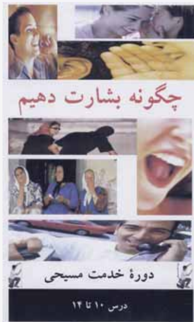
چگونه بشارت دهیم 114V ۱۴ درس در سه حلقه