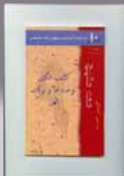
ده قدم اساسی به سوی رشد D1